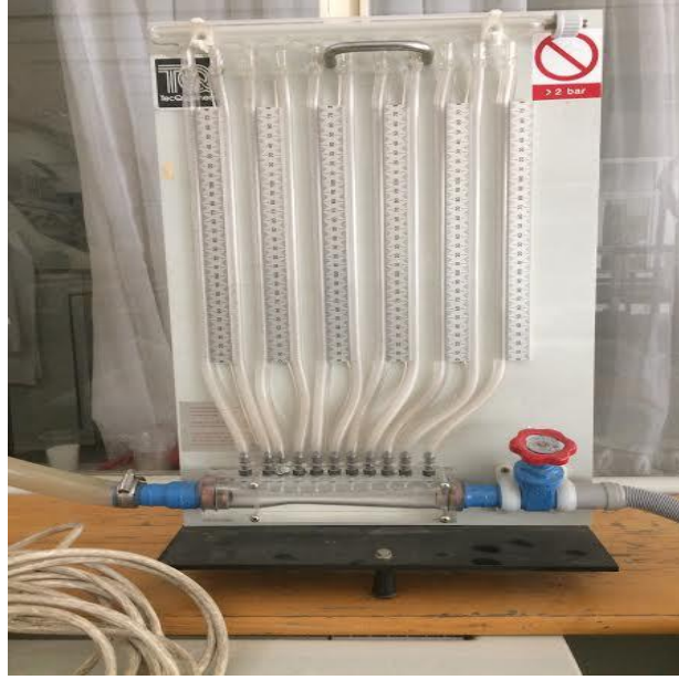
Şekil 2. Deney Setinin Genel Görünüşü

Şekil 2’de gösterildiği üzere deney sistemi, Venturimetre veya Venturi tüpü olarak adlandırılan, daralan-genişleyen dairesel kesitli konik bir boru, ventürimetre basınç kayıplarının ölçülebilmesi için belirli noktalara yerleştirilmiş manometreler, akış hızının ayarlanabilmesi için ventürimetre çıkışına bağlanmış bir vana ,hidrolik su tankı ve pompadan oluşmaktadır.