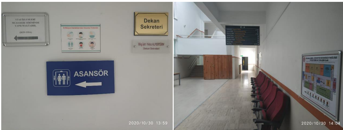
Şekil 2. Engelli öğrenciler için yapılan düzenlemelere ait fotoğraflar